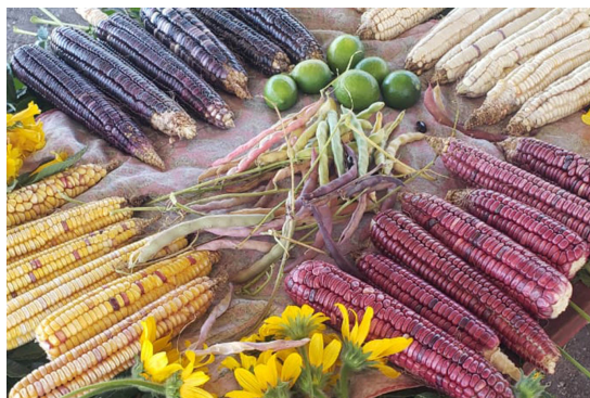
Fotografía: Wendy Pérez

“Desde ese año regresé a lo que mi padre me había enseñado y le sumé lo que mis compañeros me recomendaron. Hablamos el mismo lenguaje y coincidimos en que se debe actuar con conciencia; los químicos dañan la tierra y no actuar sólo nos llevará a deteriorar más el medio ambiente cuando hay otras formas de cultivar, dando vida y esperanza”, enfatiza este hombre orgulloso de sus milpas, donde crecen frijoles milperos que cosecha en diciembre, y calabazas.